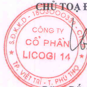
Đặng Đức Bằng